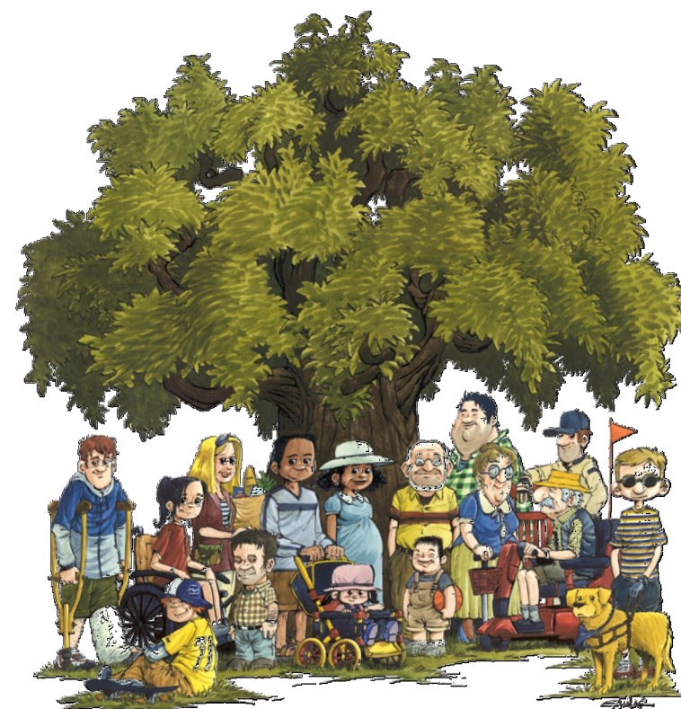
Table des aînés

L'accessibilité universelle... Pour une municipalité inclusive!